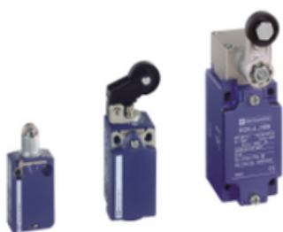
FIM DE CURSO