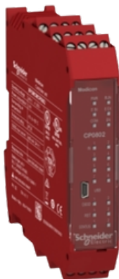
HARMONY XPS MC