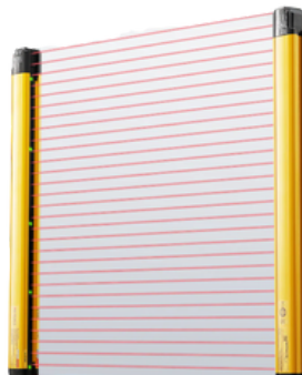
CORTINA DE SEGURANÇA