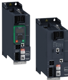
ALTIVAR MACHINE ATV340