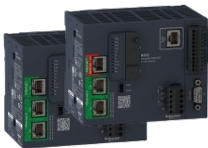
CONTROLADOR LÓGICO DE MOVIMENTO MODICON M262