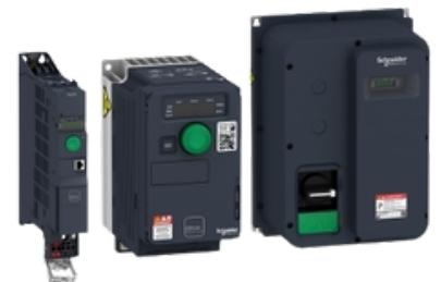
ALTIVAR MACHINE ATV320