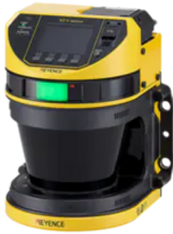
SCANNER DE SEGURANÇA A LASER