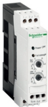
ALTIVAR SOFT STARTER ATS01