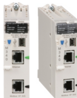
UNIDADE DE PROCESSAMENTO MODBUS E ETHERNET MODICON