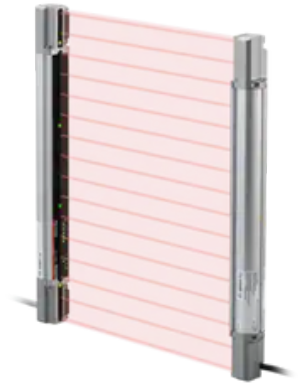
CORTINA DE LUZ DE SEGURANÇA VISÍVEL