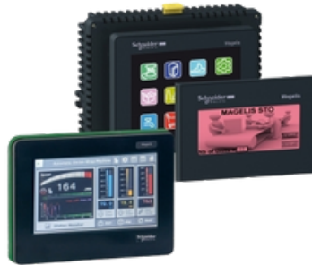
HARMONY STO - STU