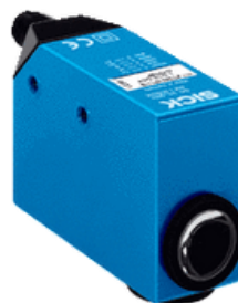
SENSOR DE CONTRASTE