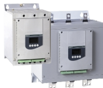
ALTIVAR SOFT STARTER ATS48

* Trabalhamos com toda a linha SCHNEIDER