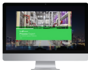
ECOSTRUXURE PROCESS EXPERT PARA AVEVA