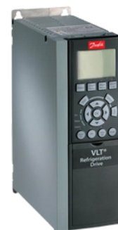
DRIVE FC 103