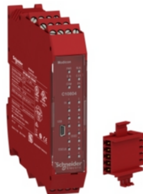
HARMONY XPS MP

* Trabalhamos com toda a linha Telemecanique