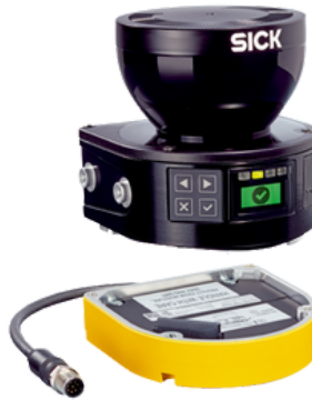
SCANNER A LASER DE SEGURANÇA MICROSCAN3