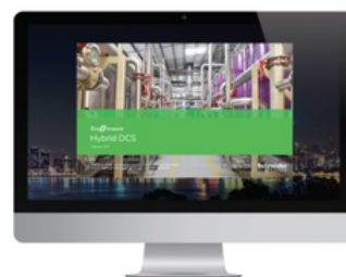
ECOSTRUXURE PROCESS EXPERT