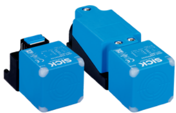
SENSORES DE PROXIMIDADE INDUTIVOS