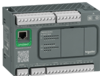
MODICON EASY M200