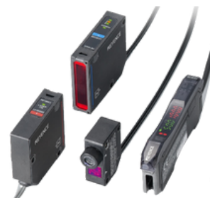
SENSOR A LASER