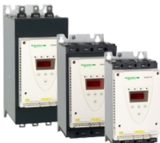
ALTIVAR SOFT STARTER ATS22