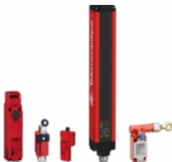
SENSOR DE SEGURANÇA