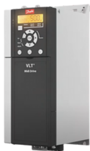
DRIVE FC 280