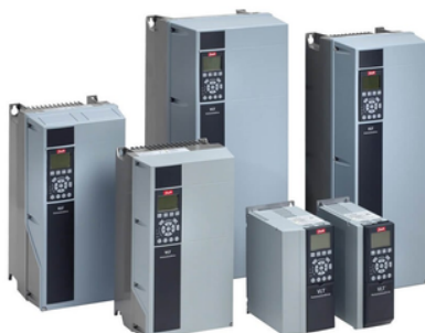
FC 301 / FC 302