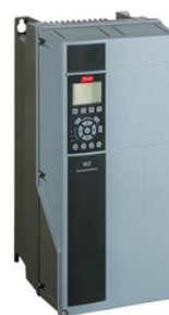
DRIVE FC 202