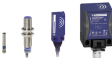
SENSOR INDUTIVO & CAPACITIVO