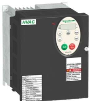
EASY ALTIVAR ATV310