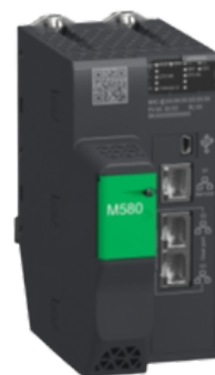
MODULO M580 PROCESSADOR 8MB - DIO